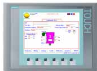
CARBO BELL 600K